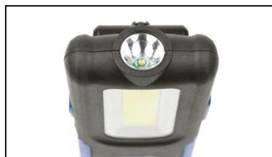
Dodatkowe światło LED od czoła