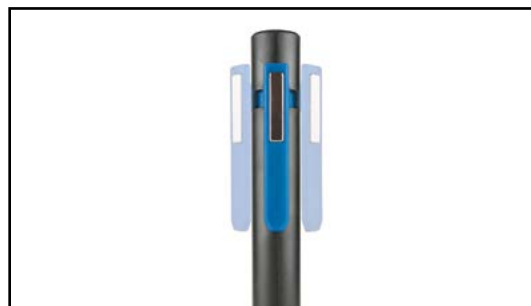
Obrotowy klips z magnesem