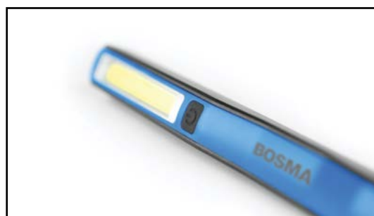
Podręczny kształt i rozmiar