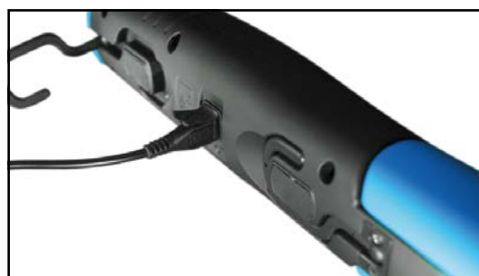
Mocny magnes na podstawie i na tylnej części