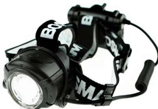
Regulacja jasności i wiązki światła