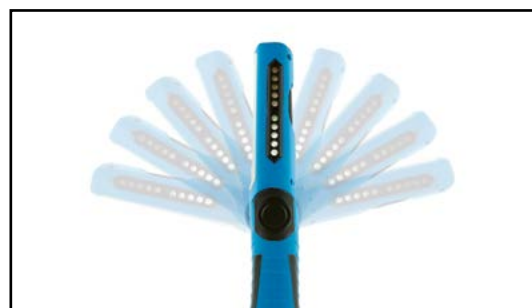
Regulacja kąta świecenia