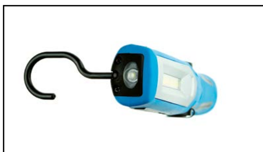
Dodatkowe światło LED od czoła