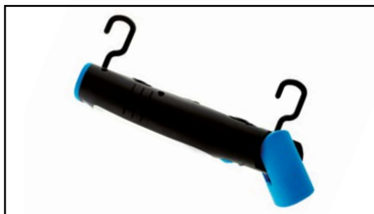
Dwa obrotowe haczyki