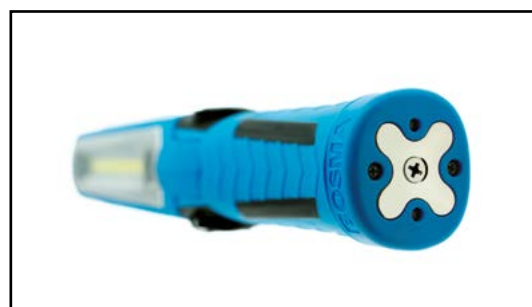
Mocny magnes na podstawie