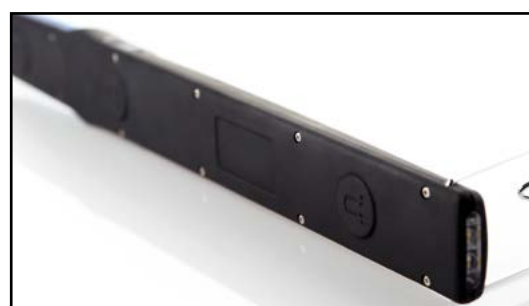
3 magnesy na tylnej części