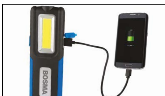
Funkcja power banku