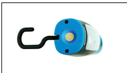
Dodatkowe światło LED od czoła