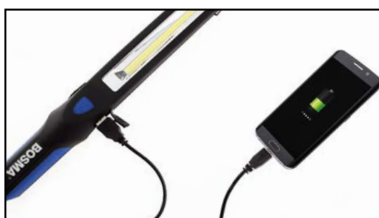
Funkcja power banku