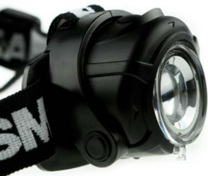
Regulacja kąta świecenia