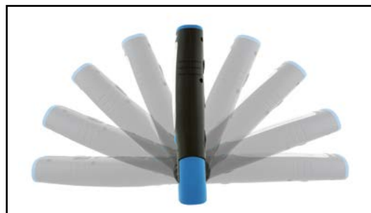
Regulacja kąta świecenia