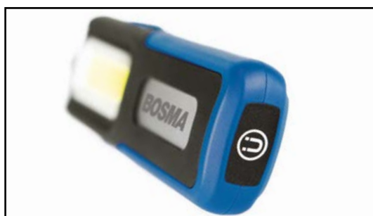
Składany uchwyt z magnesem