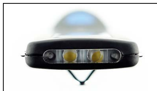
Dodatkowe światło LED od czoła