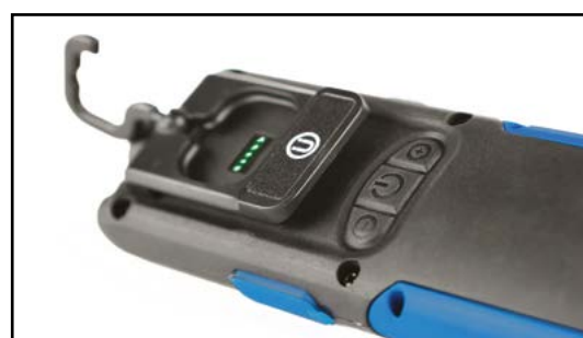
Klips, hak, magnes, wskaźnik naładowania na tylnej części