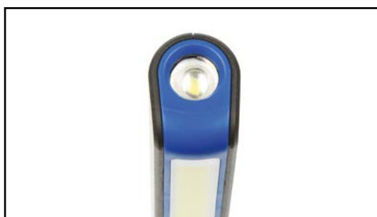
Dodatkowe światło LED od czoła