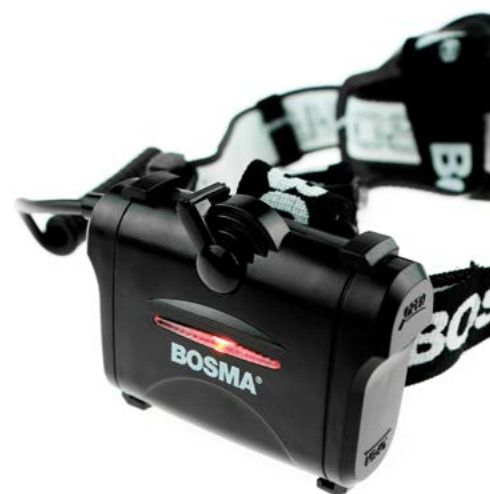
Czerwone światło z tyłu